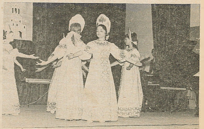
На здымку: ансамбль «Алёнка» выконвае «Рускі карагод».

Так мы выраслі. Нам ужо 4 гады. Сёлета на фестывалі мастацкай самадзейнасці наш факультэт падзяліў першае месца з фізфакам і быў узнагароджан прызам журы за лепшую арганізацыю канцэрта. У гэтым ёсць і наша праца.